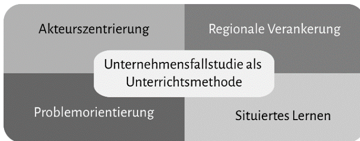
Abb. 1: Design-Prinzipien der Unternehmensfallstudie

Definieren lässt sich die Unternehmensfallstudie als Unterrichtsmethode mittels der vier Design-Prinzipien Akteurszentrierung, regionale Verankerung, Problemorientierung und situiertes Lernen (siehe Abb. 1):