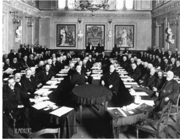
Landessynode Schleswig-Holstein 1909

Das Nordelbische Kirchenarchiv ist kein Zentralarchiv für die Bestände aller Kirchengemeinden und Kirchenkreise; es nimmt im Rahmen der kirchlichen Verfassung die Fachaufsicht über diese Körperschaften wahr und bietet eine zentrale Beständedatenbank über alle bereits elektronisch erfassten Bestände dieser Körperschaften an. Dem Nordelbischen Kirchenarchiv obliegt die Fachberatung und Schulung der Mitarbeiterinnen und Mitarbeiter in den Kirchenkreisen und -gemeinden.