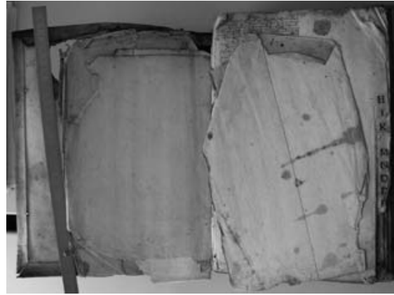
Stark geschädigtes Kirchenbuch

Bildung einer Evangelisch-Lutherischen Kirche in Norddeutschland im Jahr 2012 Die Nordelbische Evangelisch-Lutherische Kirche strebt einen Zusammenschluss mit der Evangelisch-Lutherischen Landeskirche Mecklenburgs und der Pommerschen Evangelischen Kirche zu einer Evangelisch-Lutherischen Kirche in Norddeutschland an. Die Standorte der drei landeskirchlichen Archive in Greifswald, Kiel und Schwerin sollen erhalten bleiben. Verfassung, Verwaltungs- und damit auch Archivstruktur müssen für die neue gemeinsame Kirche noch im Detail ausgearbeitet werden. Über den aktuellen Stand kann man sich informieren unter www.kirche-im-norden.de .