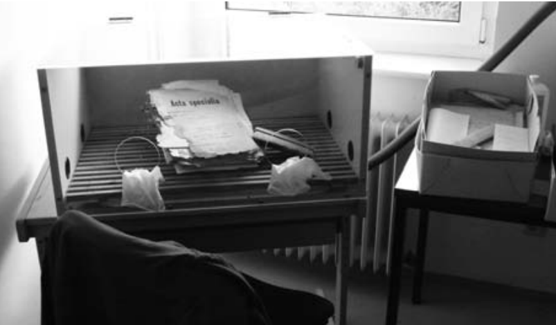
Werkbank zum Reinigen verschmutzter Akten

Bestand II: Verwaltungsschriftgut (ab 1956)