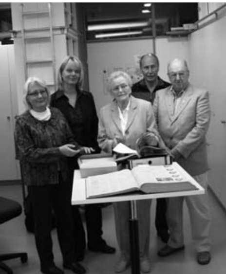
Mitarbeitende des Stadtarchivs

Dokumentation (seit 1930, ca. 20 lfd. Meter). Bildsammlung (ca. 30.000 VE): zum Beispiel Fotos, Dias, Negative und Glasplatten. Zeitungsarchiv (ca. 20 lfd. Meter): Ahrensburger Zeitung (ab 1953), Stormarner Tageblatt (1890-1995, unvollständig). Biografien von Geschäften und Persönlichkeiten (ca. 250 VE). Tonträger und Filme. Museale Objekte (ca. 900 VE). Präsenzbibliothek (ca. 1500 Bände).