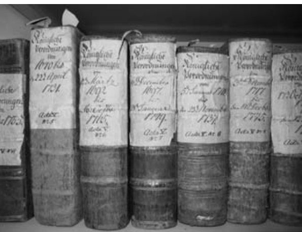
Sammlung von Verordnungen

Die Stadt Oldesloe wurde 1163 erstmals urkundlich erwähnt, um das Jahr 1286 erhielt sie das Lübische Stadtrecht. In unmittelbarer Nähe der mittelalterlichen Stadt wurde durch die Saline bis 1865 Salz gewonnen, 1813 wurde das Kurbad Oldesloe gegründet, dessen Betrieb 1928 endgültig eingestellt wurde; 1910 war der Stadt der Namenszusatz Bad verliehen worden. 1949 wurde Bad Oldesloe Stormarner Kreisstadt. In das Stadtgebiet wurden die Gutsbezirke Fresenburg und Blumendorf (1928) und die Gemeinden Rethwischfeld (1972) und Sehmsdorf (1976) eingemeindet.