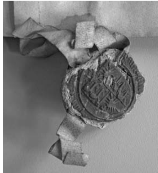
Urkunde von 1451 mit dem angehängten Siegel Adolfs VIII. von Schauenburg, Graf von Holstein, Herzog von Schleswig

Ein Zeitungsbestand (Stormarner Tageblatt ab 1939) und eine Zeitungsausschnittsammlung sind ebenfalls vorhanden.