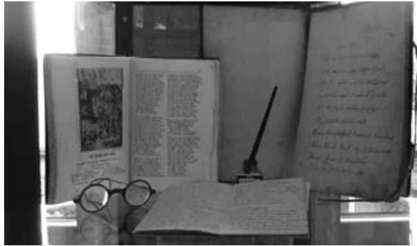
Delingsdorfer Pferdegilde von 1790

Von 1956 bis 1971 wurde durch Curt David das Archiv des Amtes Bargteheide ehrenamtlich betreut. 1959 wurden von der Stadt Bargteheide Akten zugeführt. Auch an das Landesarchiv Schleswig-Holstein sind Akten der Gemeinde Hammoor und Jersbek abgetreten worden. Seit 2001 wird im Amt Bargteheide-Land ein Amtsarchiv neu aufgebaut. Die bis dahin unsortierten Akten wurden gesichert und gesichtet. Die durch Wasserschaden schimmelbefallenen Akten werden in einer speziellen Reinraumwerkbank gereinigt.