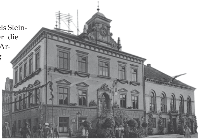
Unter der Freitreppe des Rathauses war einst der „Ratsweinkeller“. Seit 1985 befindet sich dort das Kreis- und Stadtarchiv.