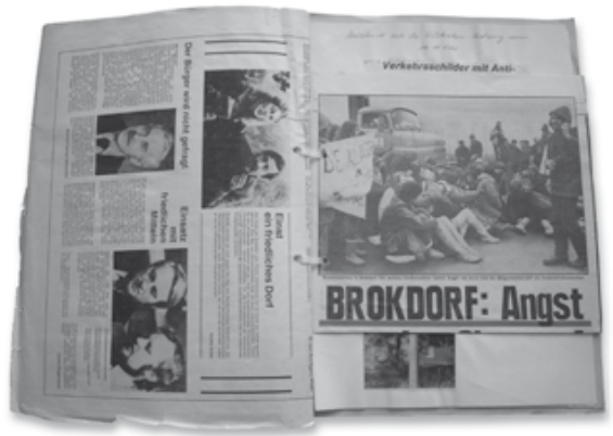
Zeitungssammlung zu Brokdorf 1981

Das Amtsarchiv ist zuständig für die Überlieferung des Amtes und der zugehörigen Gemeinden Aebtissinwisch, Beidenfleth, Brokdorf, Büttel, Dammfleth, Ecklak, Kudensee, Landrecht, Landscheide, Neuendorf-Sachsenbande, Sankt Margarethen, Stördorf und Wewelsfleth.