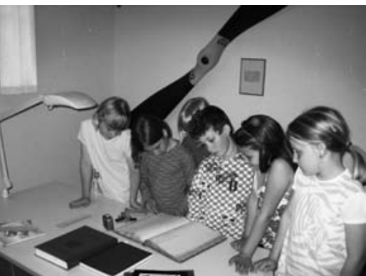
Schüler besichtigen das Archiv.