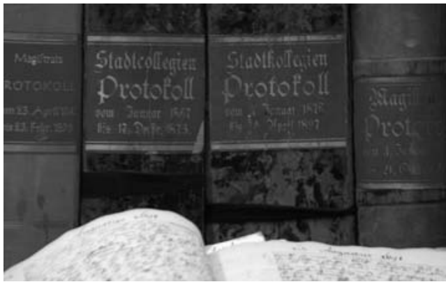
Stadtkollegien-Protokolle aus dem 19. Jahrhundert

Zum Beispiel Bürgermeister, Hauptamt, Schul- und Kulturamt, Ordnungsamt, Kämmereiamt, Steuerabteilung, Sozialamt, Bauamt, Stadtwerke, Standesamt, Nedderdütsche Volksgill.