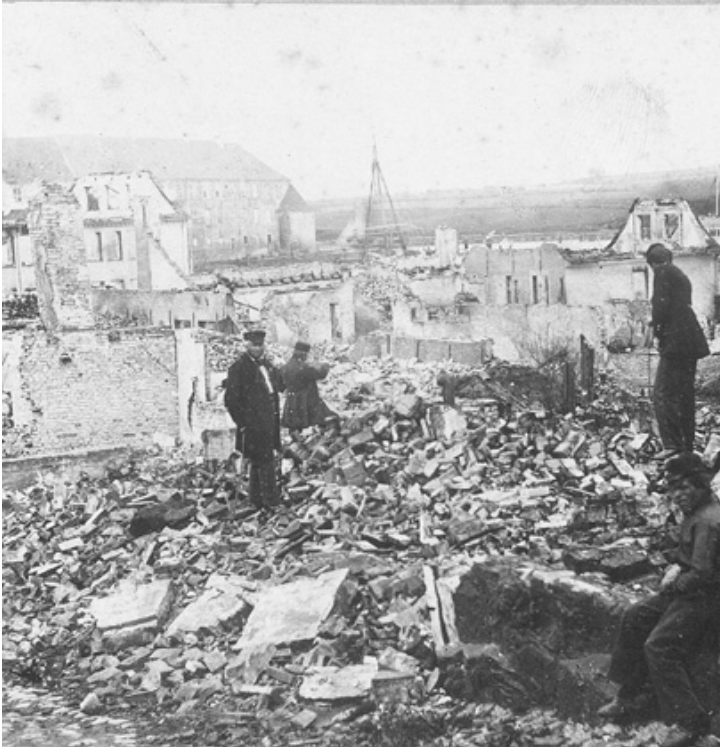
Foto fra den sydlige del af Sønderborg, hvor talrige huse var helt ødelagte.