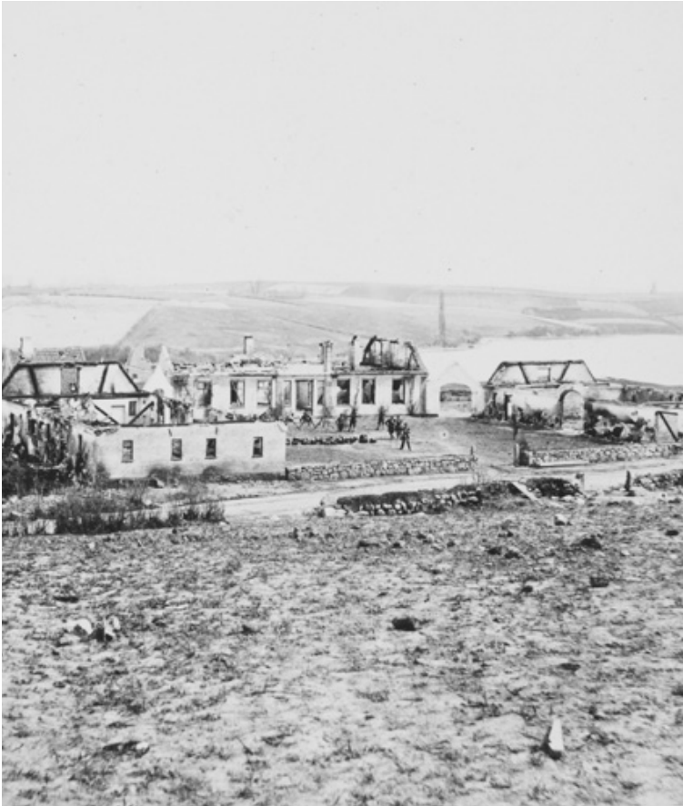
En sønderskudt gård, Stengård, nær Alssund fotograferet af Fr. Brandt fra Flensborg i april 1864.