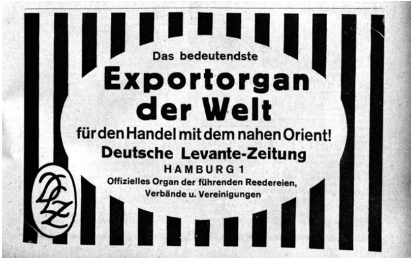
DLZ 9, Nr. 14/15 (1. August 1919), S. 251

1919 noch warb die DLZ mit dem Slogan „Das bedeutendste Exportorgan der Welt“ zu sein. 9