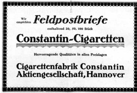
DLZ 5, Nr. 15/16 (1. August 1915), S. 329

Vergleichsweise folgerichtig wird am 1. Juni 1919 unter der Überschrift „Griechischer Staatsschuldendienst“ darauf eingegangen, dass der Anteil der griechischen Staatseinkünfte aus Tabak ca. ein Fünftel betrage. 39