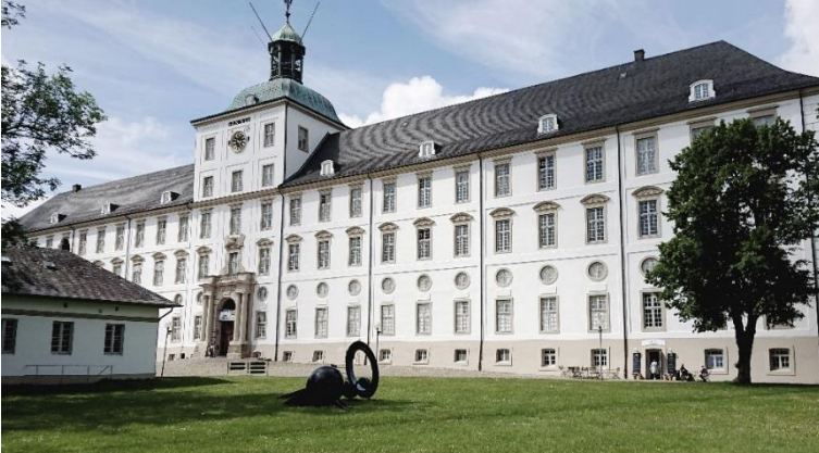
Abb. 5: Schloss Gottorf im Jahr 2019