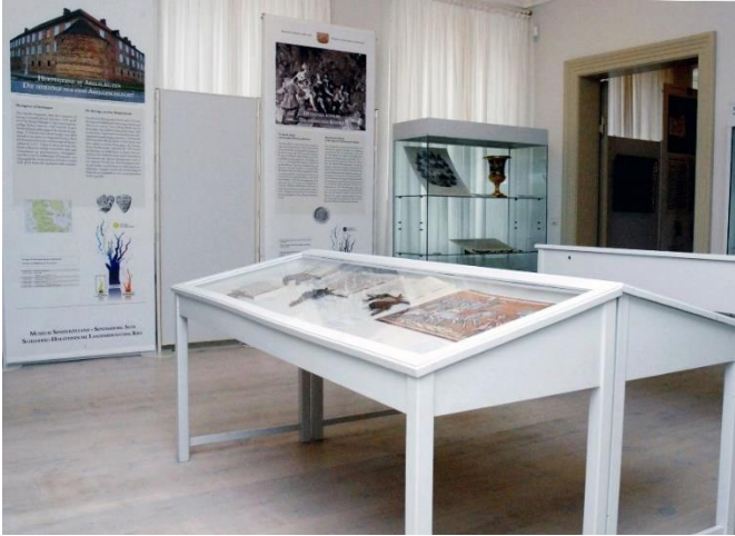
Abb. 10: Ausstellungsräumlichkeiten im Prinzenpalais