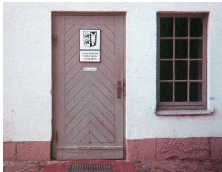
Abb. 4: Eingangstür des Landesarchivs auf Schloss Gottorf