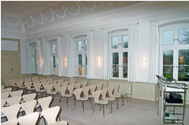
Abb. 11: Vortragssaal im Prinzenpalais