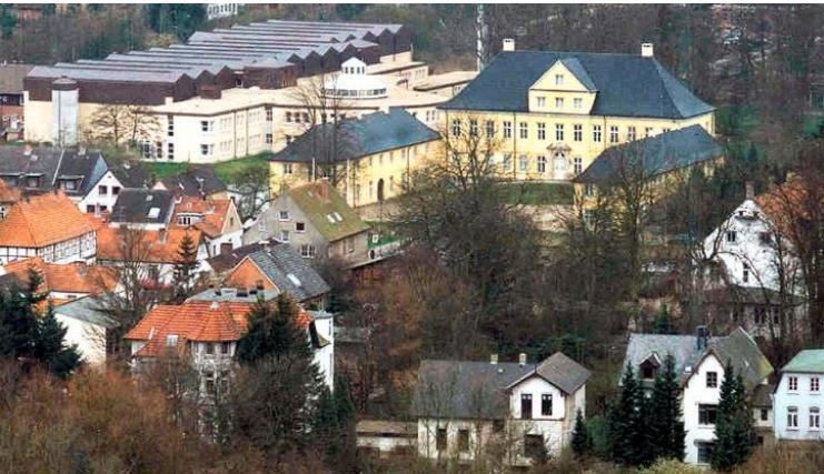
Abb. 9: Das Landesarchiv Schleswig-Holstein, Aufnahme aus dem Jahr 2008