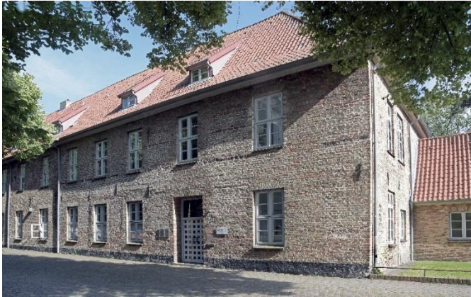
Abb. 1: Der Hattensche Hof in der Schleswiger Süderdomstraße im Jahr 2019, erster Sitz des preußischen Staatsarchivs