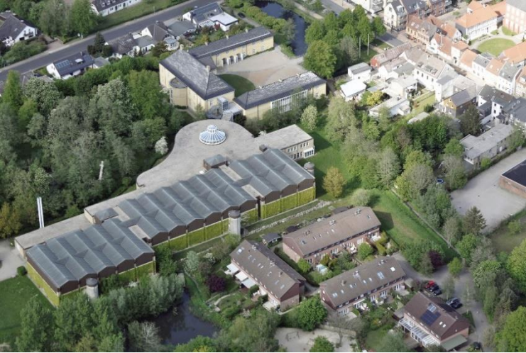
Abb. 8: Das Landesarchiv Schleswig-Holstein, Aufnahme aus dem Jahr 2016