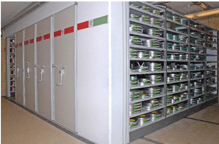
Abb. 14: Magazin des Landesfilmarchivs