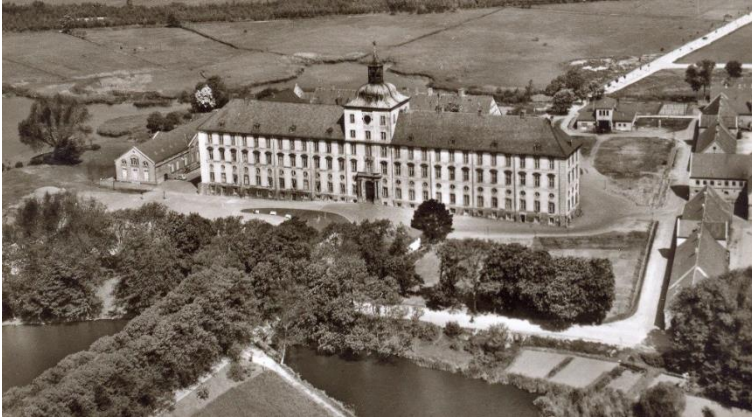
Abb. 3: Ansicht von Schloss Gottorf, ungefähr 1950, Dienstsitz des Landesarchivs nach dem Zweiten Weltkrieg (LASH Abt. 2003.1 Nr. 916)