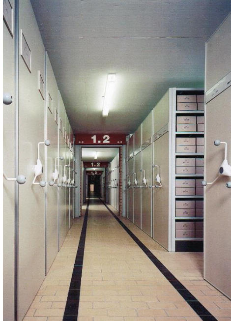
Abb. 13: Magazinraum mit Rollregalanlagen