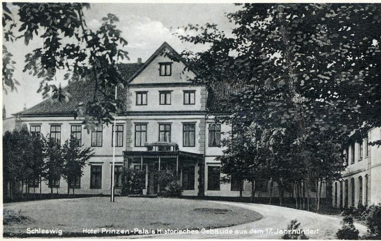
Abb. 6: Das Prinzenpalais in Schleswig, ungefähr 1935 (LASH Abt. 2003.1 Nr. 4545)