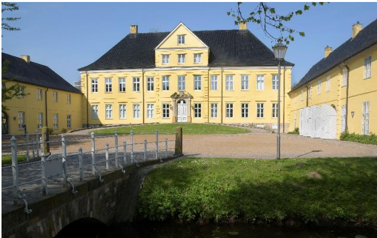
Abb. 7: Das Prinzenpalais, heutiger Dienstsitz des Landesarchivs Schleswig-Holstein, Aufnahme aus dem Jahr 2019