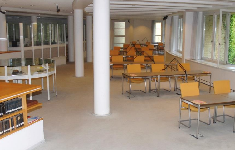
Abb. 12: Lesesaal im Archivzweckbau