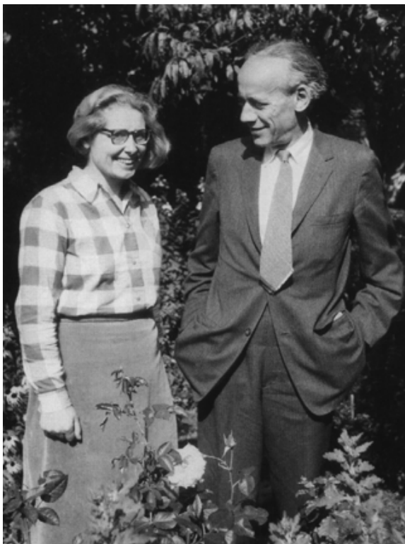
Abb. 7: Hel Braun und Emil Artin, Hamburg 1960