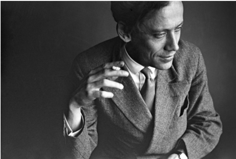
Abb. 5: Emil Artin