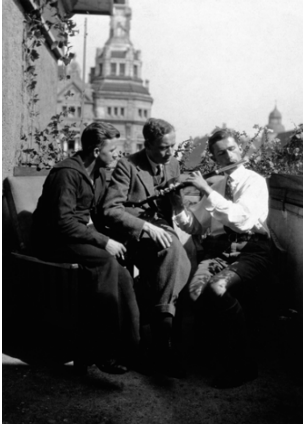
Abb. 2: Emil Artin (Mitte) zusammen mit zwei Kommilitonen in Leipzig

gewandte Mathematik nachfolgte. Herglotz arbeitete über mannigfache Gebiete der angewandten und der reinen Mathematik, aber Algebra und Zahlentheorie gehörten eigentlich nicht zu seinen Schwerpunkten.