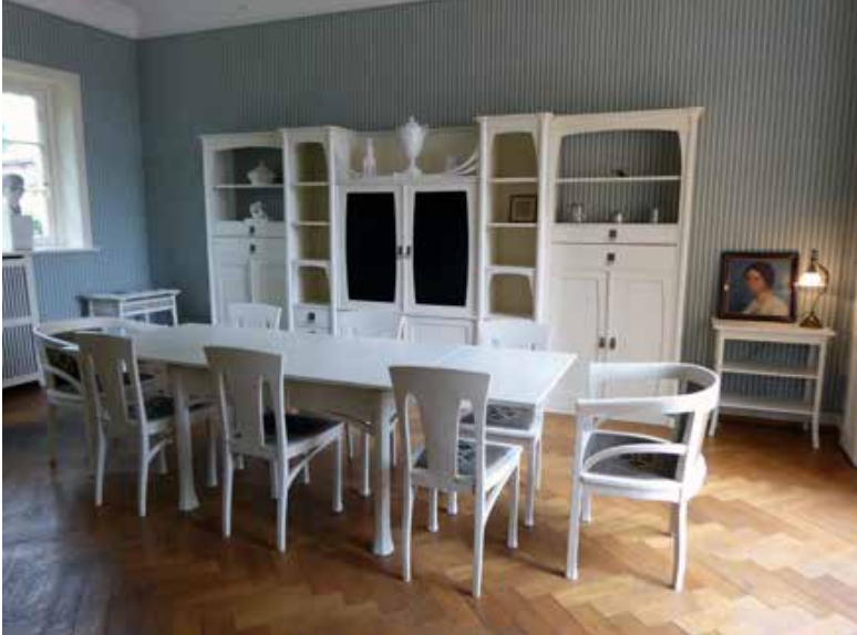
Abb. 17: Anrichte, Tisch und Stühle im Speisezimmer (2017)

ranten, wie Peter Behrens ihn bevorzugte. 281 Zwar wurde Wert auf eine überzeugende Gesamtwirkung gelegt, doch wo das Auge des Betrachters nicht hinreicht, wurde sparsam mit Verarbeitung und Farbe umgegangen. Man kann daraus zweierlei schließen: Zum einen entsprach es dem Zeitgeist, die Ästhetisierung der Alltagswelt auch außerhalb wohlsituerter Kreise mit einfacheren Mitteln fortzuschreiben. Zum anderen erscheint der allein als Dichter rezipierte Künstler Richard Dehmel durch die nachgewiesene Tätigkeit als Entwerfer und Formgeber in einem anderen Licht. Ist es doch gerade das Selbstverständnis als aufnahmebereiter Universal-künstler, das Dehmels enorme Präsenz in den Kunstkreisen um 1900 erklären kann.