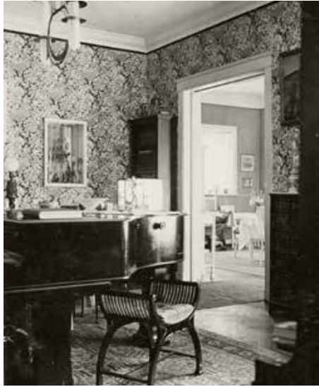
Abb. 13: Wohnzimmer im Dehmelhaus (vor 1920)