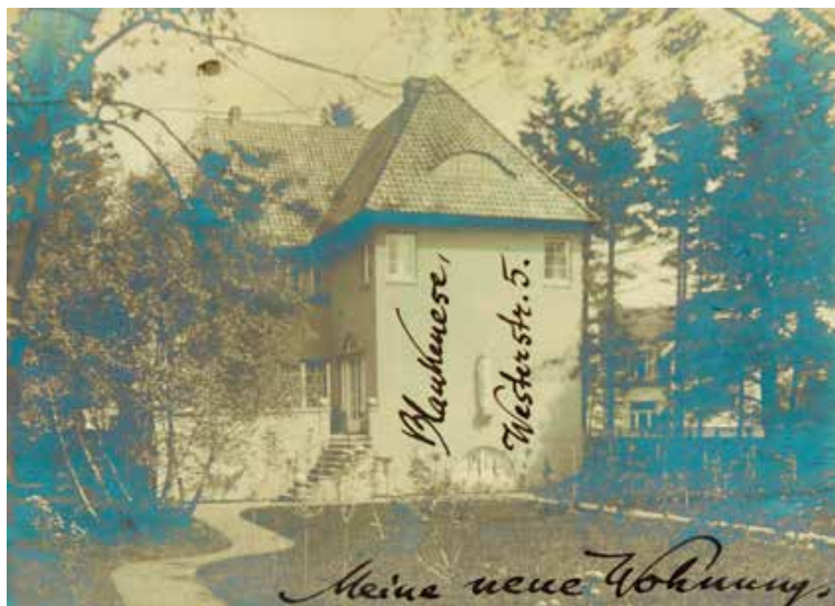
Abb. 36: Postkarte von Richard Dehmel (1913)