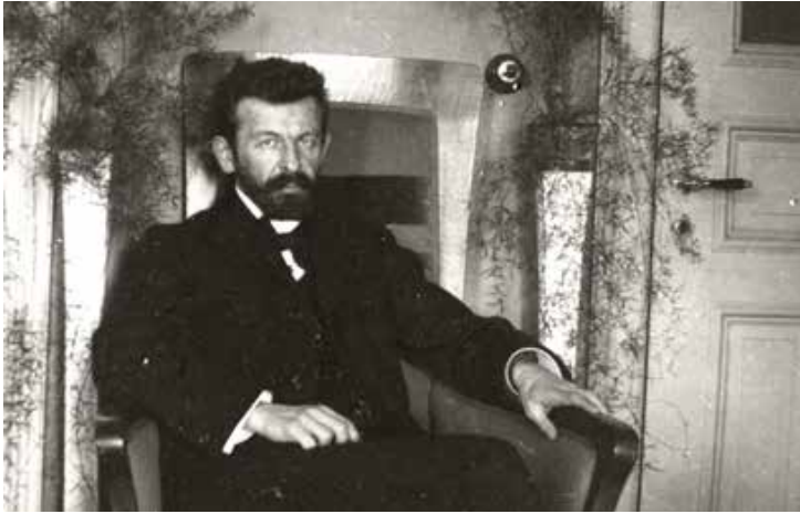
Abb. 2: Richard Dehmel (um 1905)

der im Café Alexanderplatz tagte, erschien 1891 sein erster Gedichtband Erlösungen . 1892/93 zählte er zu den Bohemiens um den Schweden August Strindberg, die im legendären Berliner Lokal Zum schwarzen Ferkel ausgelassene Sitzungen abhielten und die Künste zelebrierten. Zu dieser anregenden Runde gehörten auch der polnische Schriftsteller Stanisław Przybyszewski 44 und dessen norwegische Frau Dagny Juel, die Maler Edward Munch, Christian und Oda Krohg, der Arzt Carl Ludwig Schleich, der Fantast Paul Scheerbart und andere mehr. Ida Dehmel schrieb später: „Dehmel war immer stolz darauf, dass diese Zusammenkünfte, so alkoholdurchtränkt sie auch waren, niemals im Gemeinen endeten. Es waren Orgien der Kunst, Übersteigerungen der schöpfenden Phantasie.“ 45