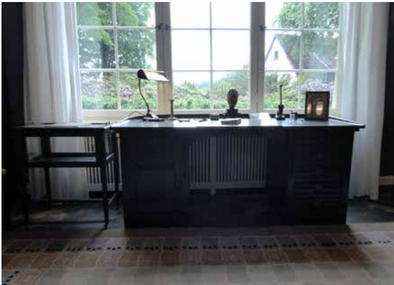
Abb. 50: Richard Dehmels Schreibtisch (2016)