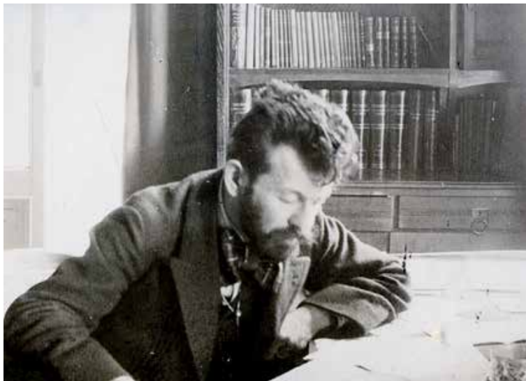
Abb. 32: Richard Dehmel am Schreibtisch (vor 1912)