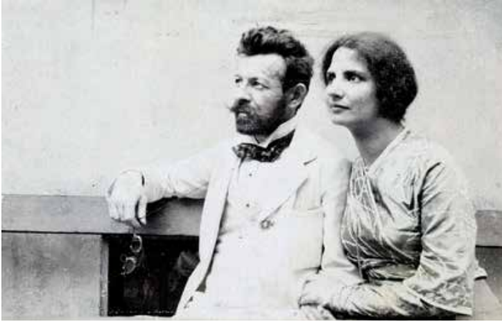
Abb. 1: Richard und Ida Dehmel (1901)

bis dahin geschaffen hatte. Das Schaffen der darauffolgenden Jahre wird zusammen mit der Hausgeschichte nachvollzogen und daher Bestandteil folgender Kapitel sein.